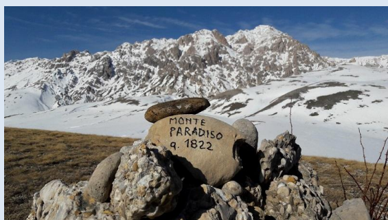
Il panettone erboso delle Veticole

Nel cuore del Piccolo Tibet d'Abruzzo, una vetta dolce ed erbosa che poteva averesolo questo nome visto il panorama da cui si gode: il monte Paradiso